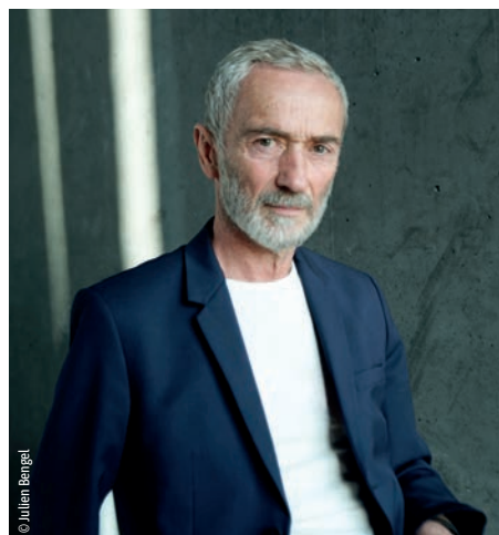
Figure de proue de la scène contemporaine depuis la création de sa compagnie en 1985, Angelin Preljocaj a chorégraphié plus de 60 pièces. Il s'associe régulièrement à d'autres artistes : musiciens, designers, créateurs de mode, dessinateurs... Il alterne des projets abstraits et radicaux avec des ballets narratifs tels que Blanche Neige ou Le Lac des cygnes . Il réalise aussi des films, et a récemment été élu à l'Académie des beaux-arts.